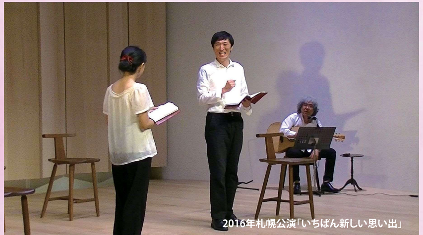
2016年札幌公演「いちばん新しい思い出」